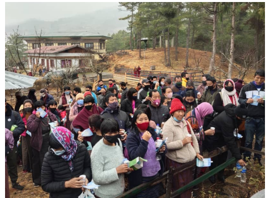
(図3) ダワカ地区で除菌判定の呼気テストを受ける住民